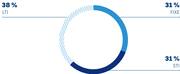
STRUCTURE THÉORIQUE DE LA RÉMUNÉRATION 2026 DES DMS À OBJECTIFS ATTEINTS À 100 %