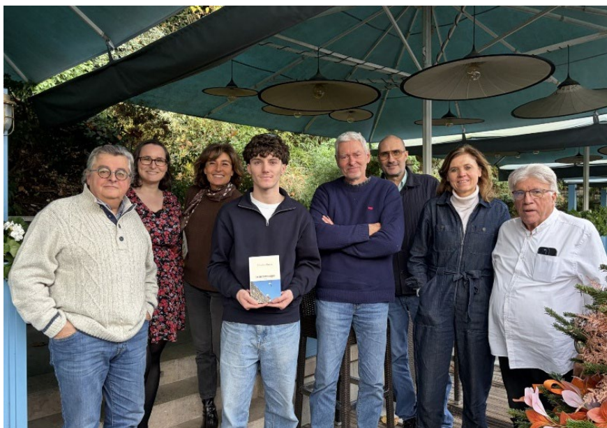
FDJ UNITED - Le jury Sport Scriptum, réuni le 25 novembre 2025, à Issy-les-Moulineaux